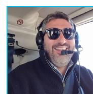
Raphaël Dore Donateur SarL La Broue 21