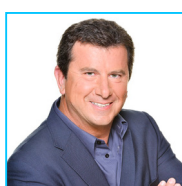
Pascal Bataille Parrain Animateur TV