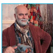
Philippe Model Parrain Créateur de mode