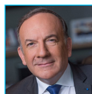
Pierre Gattaz Parrain Président du MEDEF